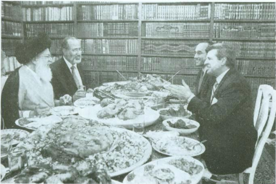
عشاء في منزل آية الله حسين الصدر (من اليسار إلى اليمين): آية الله الصدر، مستشار الأمن القومي العراقي موفق الربيعي، دان سينور، بريمر